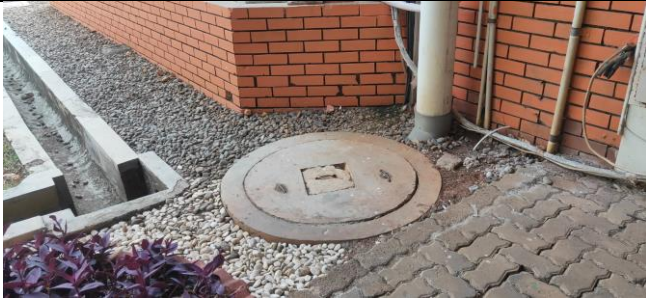
Sumur Resapan di Gedung Dekanat

Fakultas : Ekonomi dan Bisnis UI Web Address : www.feb.ui.ac.id