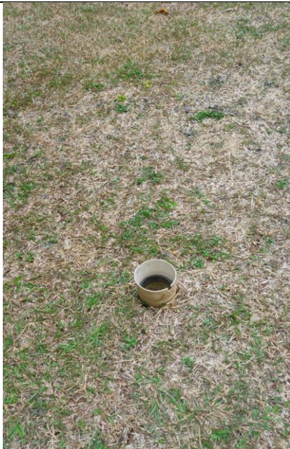
Lubang Resapan Biopori di Taman Gedung Pascasarjana FEB UI

pada tahun 2019 yaitu sebesar 840.000 m 3 /tahun. Sehingga diperoleh rasio antara air yang dapat dikonservasi sebesar 50,46% dari keseluruhan penggunaan air di FEB UI.