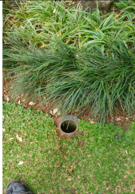
Lubang Resapan Biopori di Gedung Departemen Manajemen