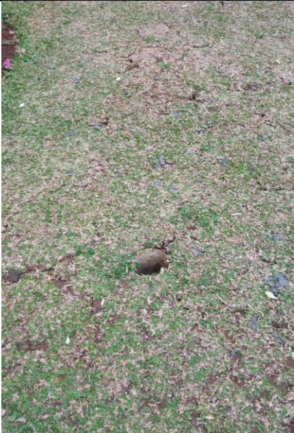
Lubang Resapan Biopori di Taman Gedung Selasar Dosen FEB UI

Fakultas : Ekonomi dan Bisnis UI Web Address : www.feb.ui.ac.id