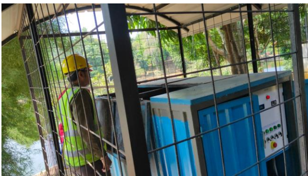
Intalasi pengolahan air limbah