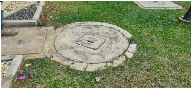
Sumur Resapan di Gedung Pascasarjana