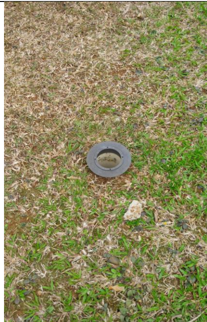
Lubang Resapan Biopori di Taman Gedung Selasar Dosen FEB UI