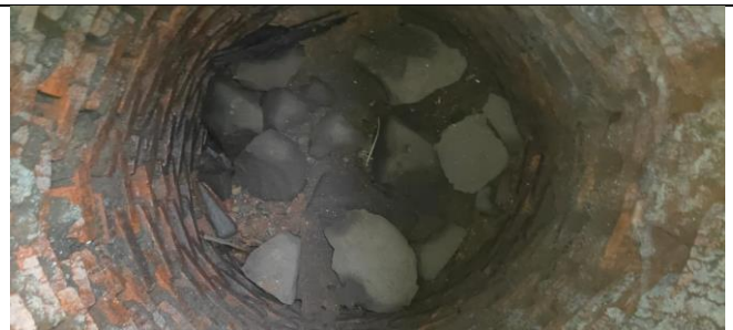
Bagian Dalam Sumur Resapan