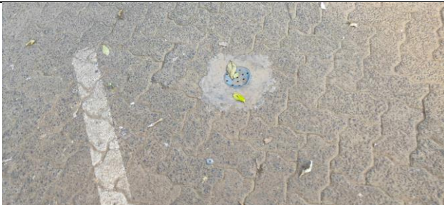
Pembuatan bioperi di area parkir untuk mengurangi genangan air