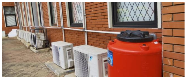
Penampungan air drain AC, yang ditampung dalam toren