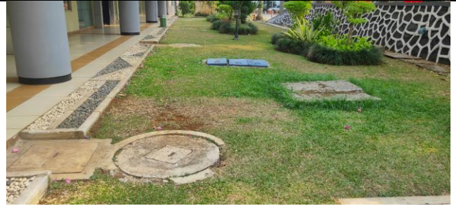
Sumur Resapan di Gedung Pascasarjana