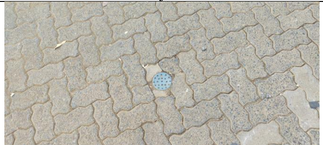
Pembuatan bioperi di area jalan FEB UI