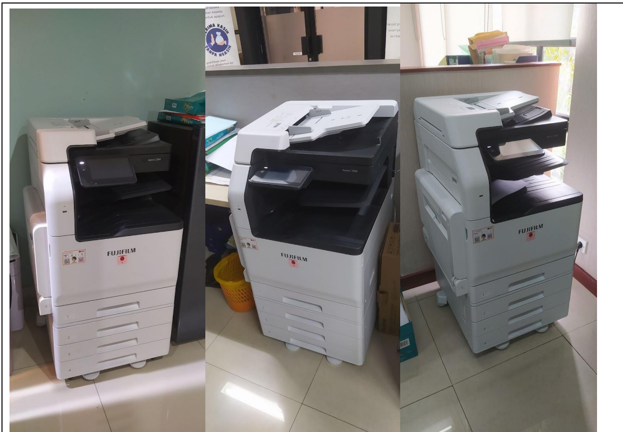
Penggunaan printer jaringan untuk penghematan energi di ruang Dospem-IR, Biro pendidikan, & SDM