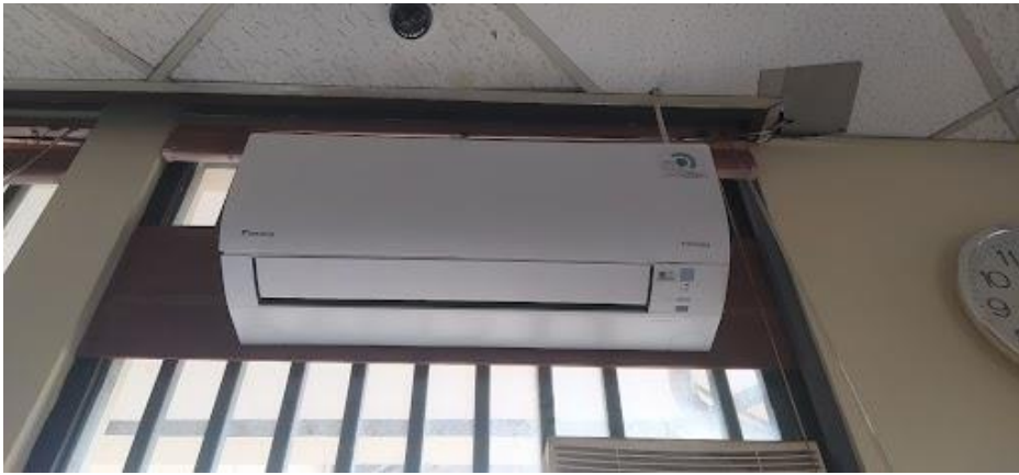
Penggunaan AC Inverter untuk penghematan energi di ruangan CELEB, Humas, & KIVK