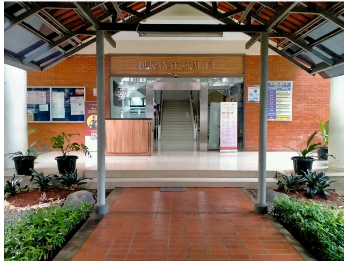
Tanaman di sepanjang selasar gedung