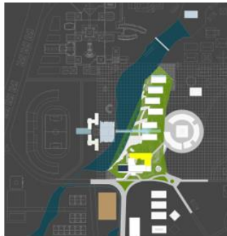
Gambar 2-1. Masterplan Area Fakultas Ilmu Administrasi UI

Sehingga untuk masterplan ini dengan konsep axis dimana blok massa bangunan mengikuti dari axis tersebut.