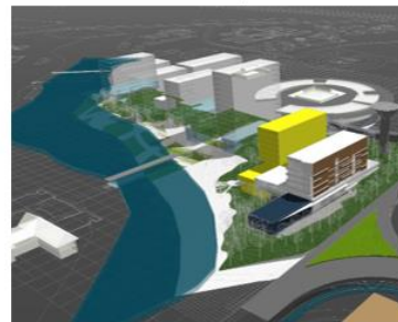
Gambar 2-3. Fase Tahap 2