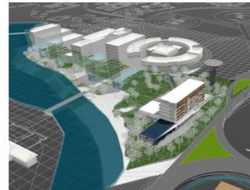
Gambar 2-2. Fase Tahap 1

Konsep perencanaan terbagi atas 2 fase dapat dilihat pada gambar dibawah ini, fase tahap 1 dan fase tahap 2. Massa yang berwarna kuning merupakan fase tahap 2 yang akan direncanakan.