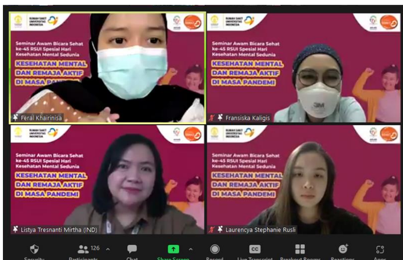
Gambar 4 : Sesi Diskusi