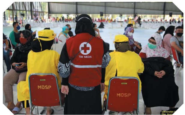
Sentra Vaksinasi di Sarana Olahraga UI. Vaccination Center at the UI Sports Center.