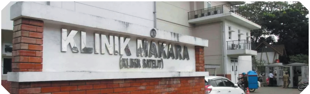
Klinik Makara UI UI Makara Clinic

To raise awareness in the campus community for a healthy lifestyle, UI has been regularly organized the "Healthy Campus" program since 2019. This initiative is also based on a collaboration between UI and the Ministry of Health as a concrete effort to achieve health promotion and disease prevention.