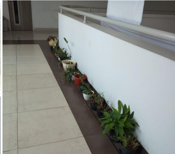
Contoh tanaman hijau di dalam gedung dan di dalam ruangan