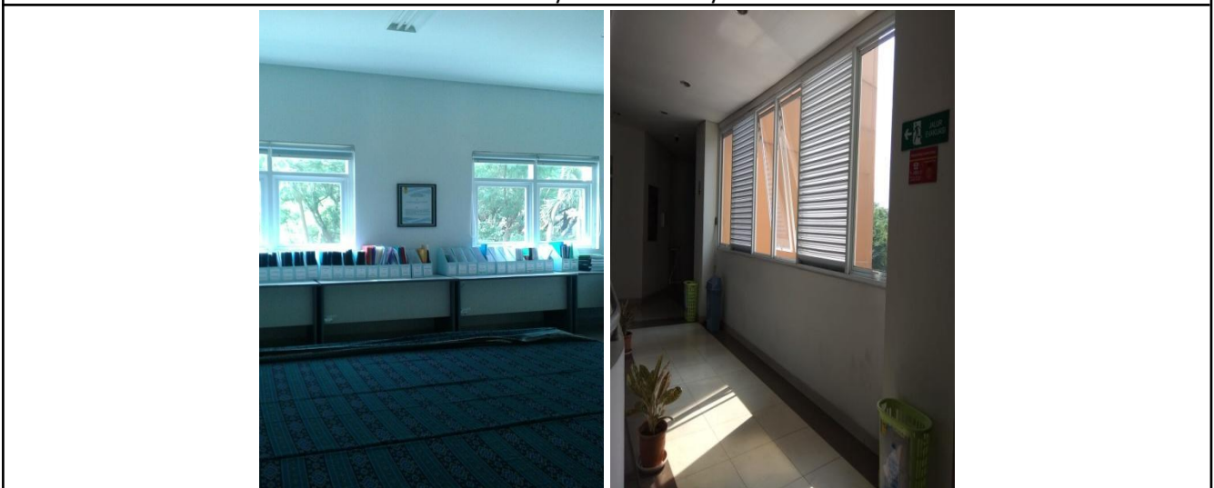
Contoh Ventilasi Alami