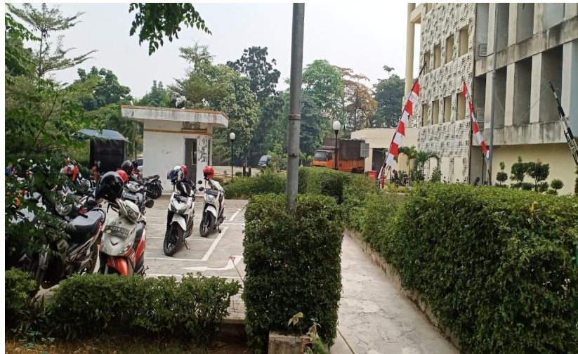
Contoh area taman dan tanaman hijau di FIK UI