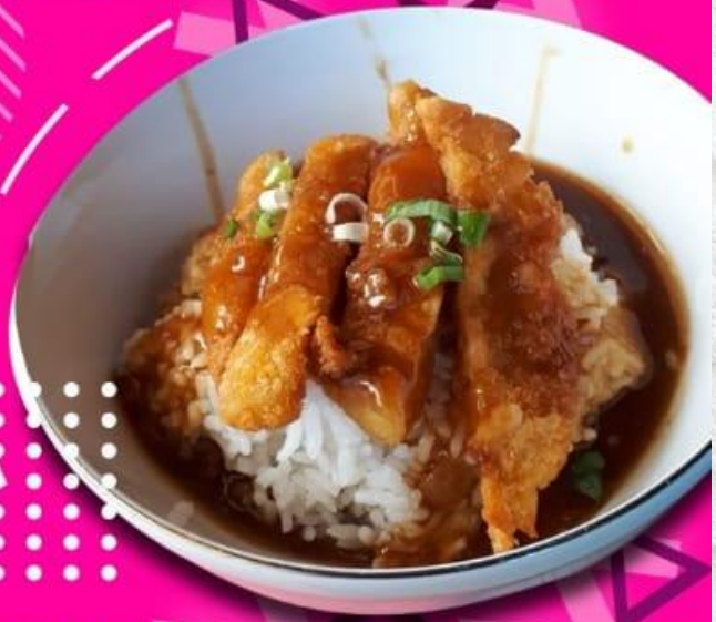
RICE MALAY RP 16.000