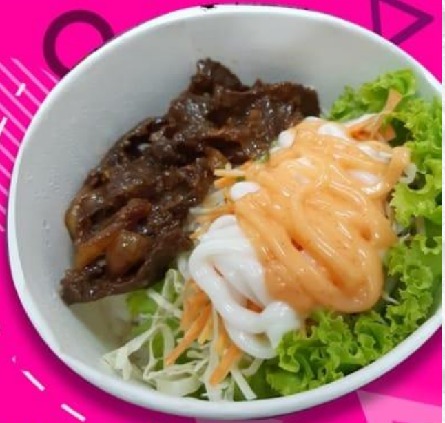
NASI MANGKUK DAGING RP 22.000

oriental (nasi, katsu saos asam manis) nasi Bento Rp. 16.000