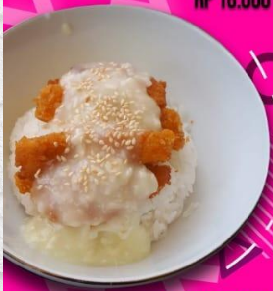
CHEESE CREAM RP 20.000